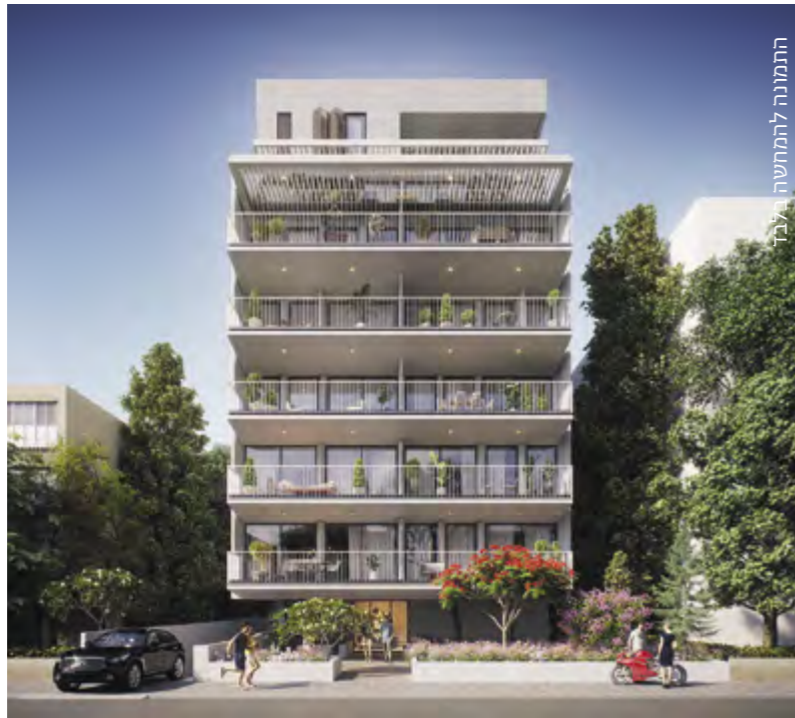
התמונה להמחשה אינה