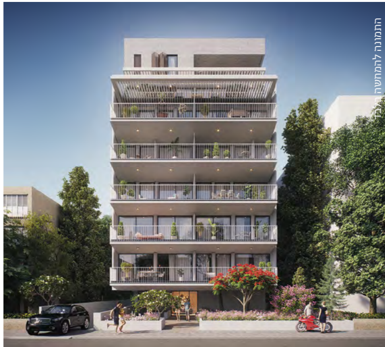
התמונה להמחשה אינה